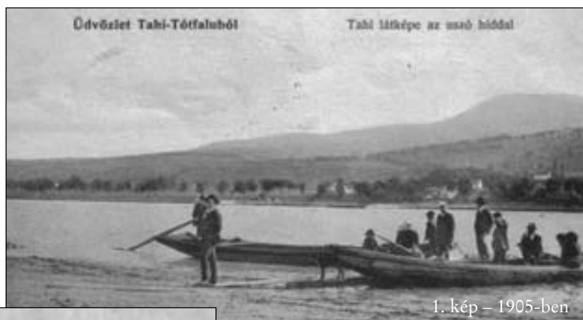
1. kép – 1905-ben

Hídja már volt szeretett szigetünknek a római korban több is. Ebből a római korban épített két híd maradványa a partmenti védőgátak alatt található, az egyik Tahitótfaluban. Az újkori kezdetek a sajkákkal való átkelés (1. kép), majd az úgynevezett „repülő híd” (2. kép). Állandó hídja újra csak 1914-ben lett, ami Almássy híd nevet kapta (3. kép). A híd felépítésének ötlete Fülöp Béla református tanítóé volt. Ezt 1944-ben felrobbantották a németek, 1945-ben az orosz hadsereg cölöphídat épített. Ezután Tildy Zoltán idejében építették a keskeny