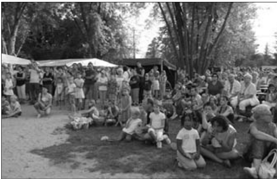
Surány 75

azok, akik örömmel vettek részt és jól érezték magukat a születésnap ünnepségeken.