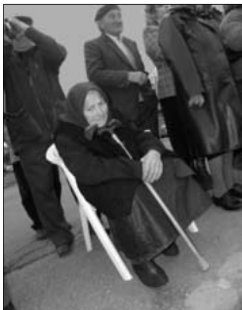
A néni talán a régi hídra gondol