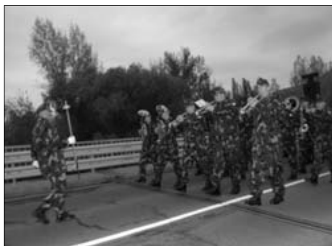
A névadó ünnepség után a résztvevők átvonultak a hídon a katonazenekar vezetésével Tótfalura.