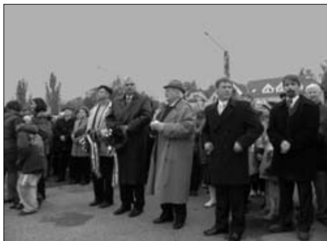
Dr. Boros Péter volt miniszterelnök