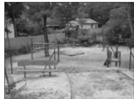
A Liget téri játszótér

A surányiak régi kérése teljesült, amikor Surány III-nál felállításra került a fedett autóbusz váró fülke. Nem kell