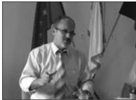
Szabó Imre környezetvédelmi miniszter

Ugyancsak szeptemberben láttuk vendégül a mikrotérség polgármestereivel együtt Szabó Imre környezetvédelmi minisztert, támogatását kérve a