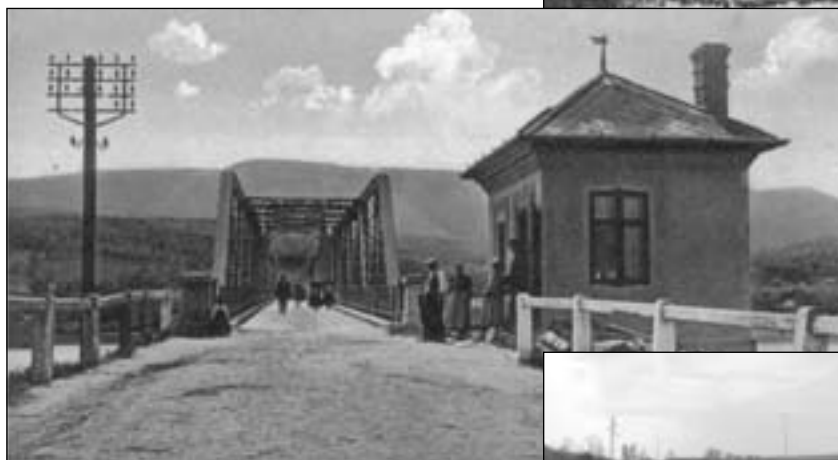
és ma a Tildy Zoltán híd