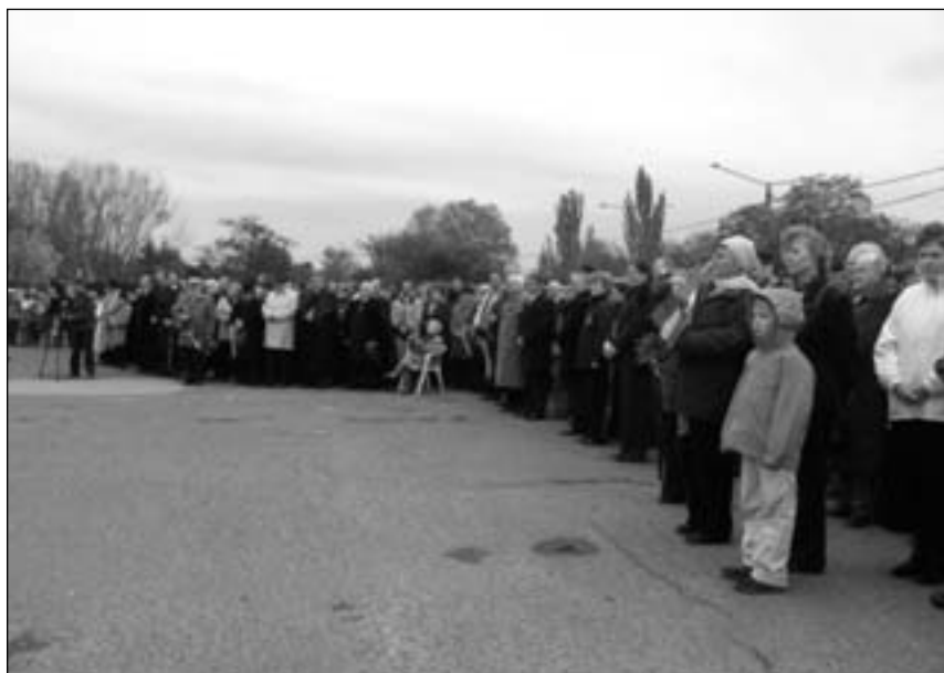
Az ünnepen nagyon sokan vettek részt, egy kis részük